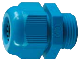
095801 IP68 étanche Fonction certifiée Ex i