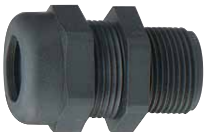
095756 Certifié Ex e

Série EEXe : Entrées de câble en polyamide pour câble non armé - Sécurité augmentée