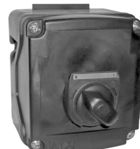
16 A Version – Type 2