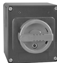
20 A Version