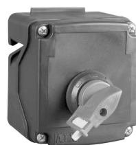
16 A Version – Type 1